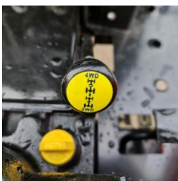
Cuplare decuplare 4x4