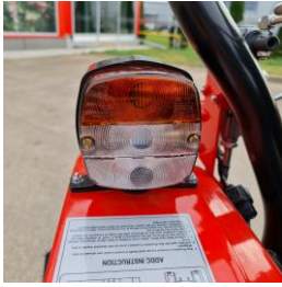
Lampa pozitie si semnalizare fata spate pe aripa