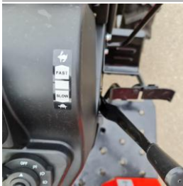
Acceleratie de mana