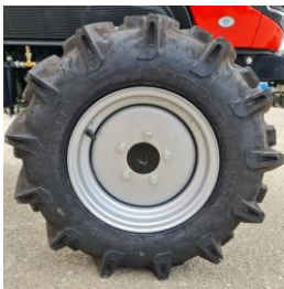
Anvelope AGRI fata 5.00-12