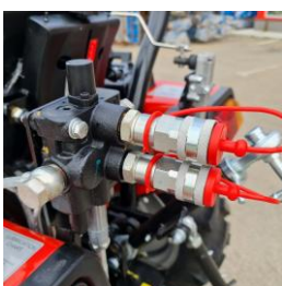
Distribuator dublu efect