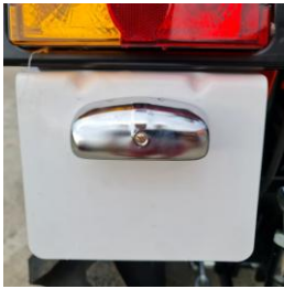
Placa sustinere numar de inmatriculare