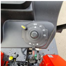
Intrerupator multifunctional semnalizare lumini + claxon