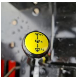
Cuplare priza putere doua trepte 540 rpm-1000 rpm