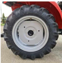
Anvelope AGRI spate 8-18