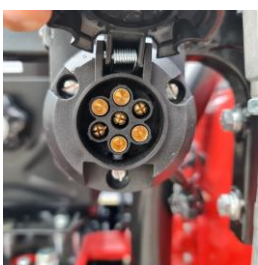
Priza remorca 7 pini