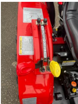
Maneta tiranti spate