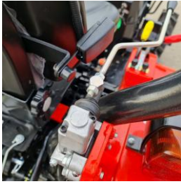
Maneta distribuitor hidraulic dublu circuit